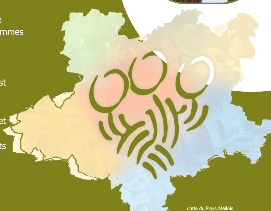
carte du Pays Mellois